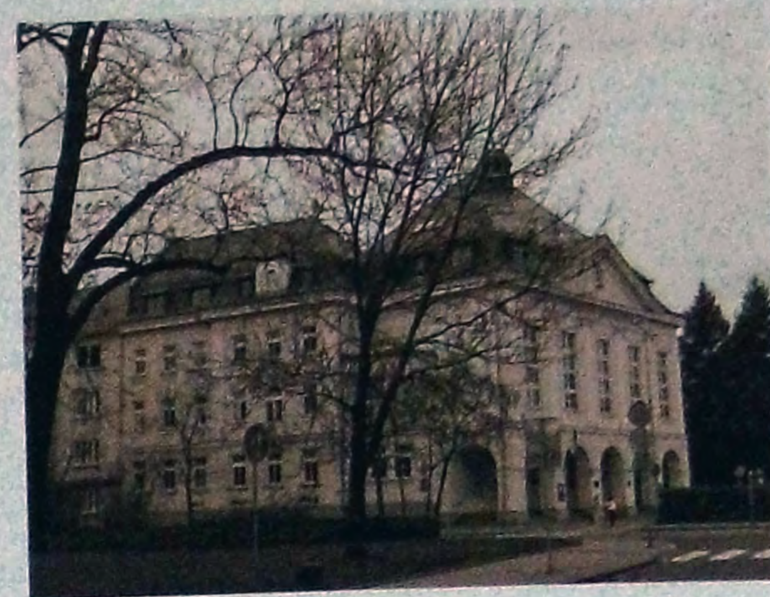
Ilustracja A.11. Uniwersytet Śląski w Opawie ( Slezská universita v Opavě ).

Podobnie jak po pierwszej, także po II wojnie światowej doszło na Górnym Śląsku do zmian wewnętrznych i zewnętrznych granic, przy czym wszystkie decyzje dotyczyły siłą rzeczy jedynie Polski i Czechosłowacji. Pojedyncze decyzje z okresu wojny zachowały się, inne zmieniono. W Polsce powojennej stare województwo śląskie, były niemiecki Śląsk Opolski i Zagłębie Dąbrowskie zostały najpierw połączone w województwo śląskie („śląsko-dąbrowskie”) z siedzibą w Katowicach. Kraik Hulczyński i Zaolzie przekazano już przedtem Czechosłowacji. W ramach ostatecznego podziału administracyjnego w Polsce w 1950 roku określenie Śląsk znikło, a obszar województwa śląskiego rozdzielono na województwa opolskie i katowickie. To pierwsze obejmowało 14 powiatów – z tego 2 z województwa dolnośląskiego (brzeski i namysłowski) i 12 z dawnego województwa śląskiego (głubczycki, grodkowski, kluczborski, kozielski, krapkowicki, niemodliński, nyski, oleski, opolski, prudnicki, raciborski i strzelecki) oraz cztery miasta wydzielone (Opole, Brzeg, Nysa i Racibórz). Województwo katowickie składało się z 14 powiatów (będziński,