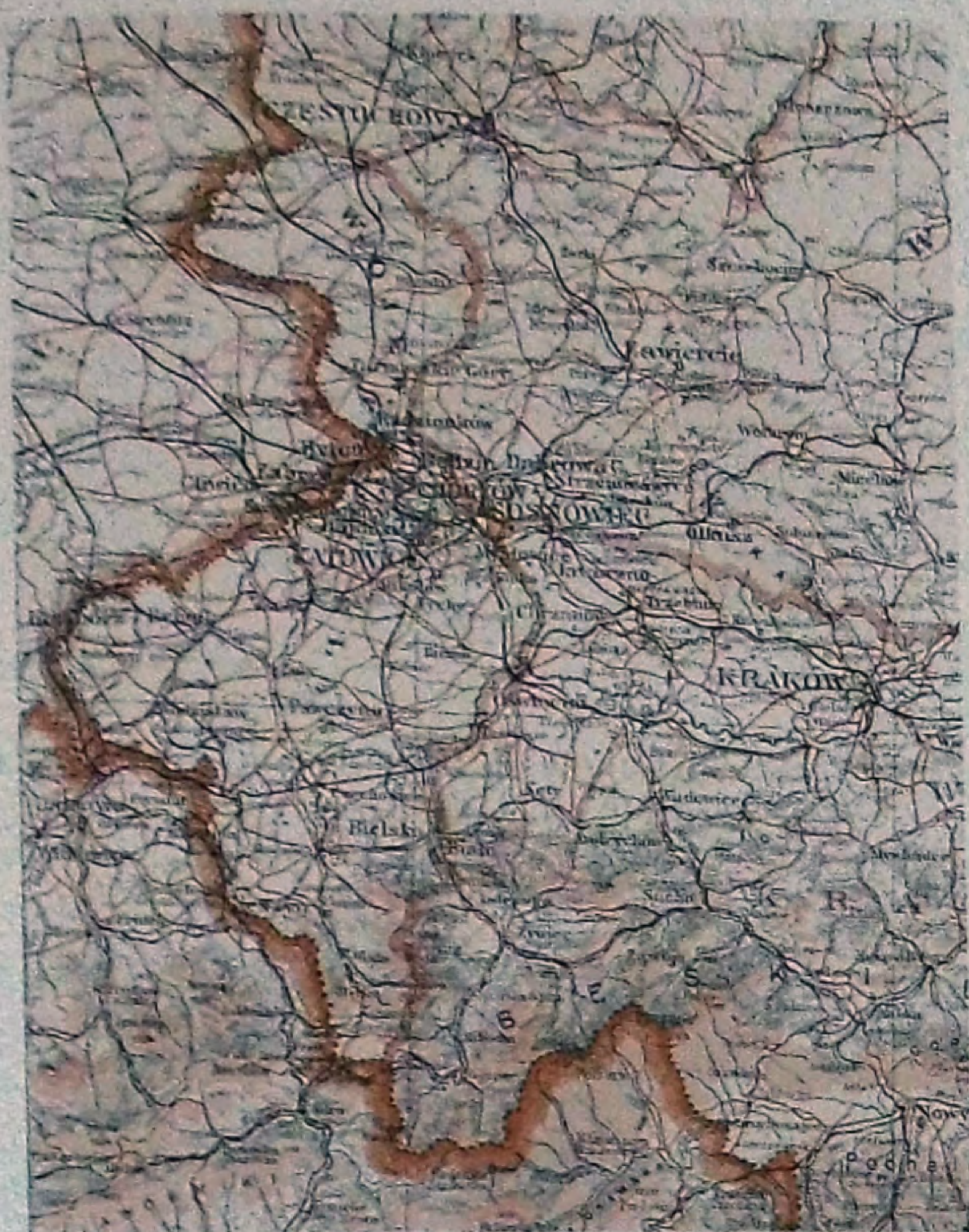
Ilustracja A.9. Mapa Rzeczypospolitej Polskiej z 1934 r..

(Zachodni Górny Śląsk), a w języku polskim – od nazwy stolicy – jako Śląsk Opolski lub Opolszczyzna. W publicystyce i wypowiedziach polityków niemieckich w okresie dwudziestolecia międzywojennego rzadko z kolei używano nazwy oficjalnej dla polskiej części Górnego Śląska – województwo śląskie/ Woiwodschaft Schlesiens , a najczęściej – Ost-Oberschlesien (Wschodni Górny Śląsk), ewentualnie Polnisches Ost-Oberschlesien (Polski Wschodni Górny Śląsk).