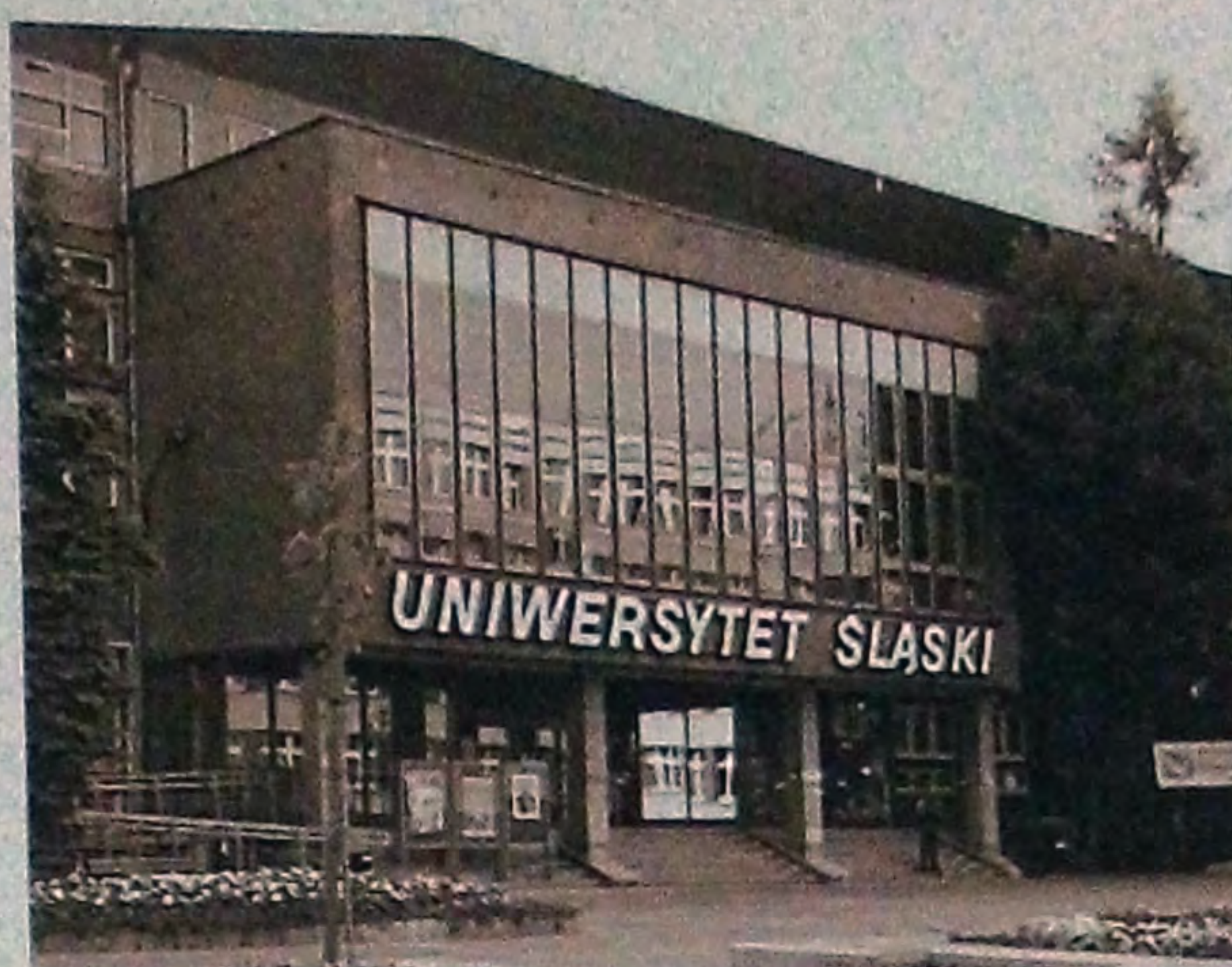
Ilustracja A.10. Uniwersytet Śląski w Katowicach, budynek Rektoratu (źródło: Uniwersytet Śląski w Katowicach, Dział Promocji).

Także w języku czeskim można zauważyć wiele nowych określeń, rezygnujących coraz częściej z odniesień do historycznej nazwy „Górny Śląsk”. Zarówno u ludności polskiej, jak i czeskiej spowodowało to, że świadomość o wspólnocie historycznej ziem górnośląskich słabła coraz bardziej na rzecz nowych tożsamości regionalnych. Odpowiada temu w językach czeskim i polskim częste posługiwanie się takimi pojęciami jak „Śląsk Opawski” lub „Śląsk Cieszyński”. Jednak z drugiej strony – i to przyczynia się znacznie do powstania pewnych niejasności – wyż-