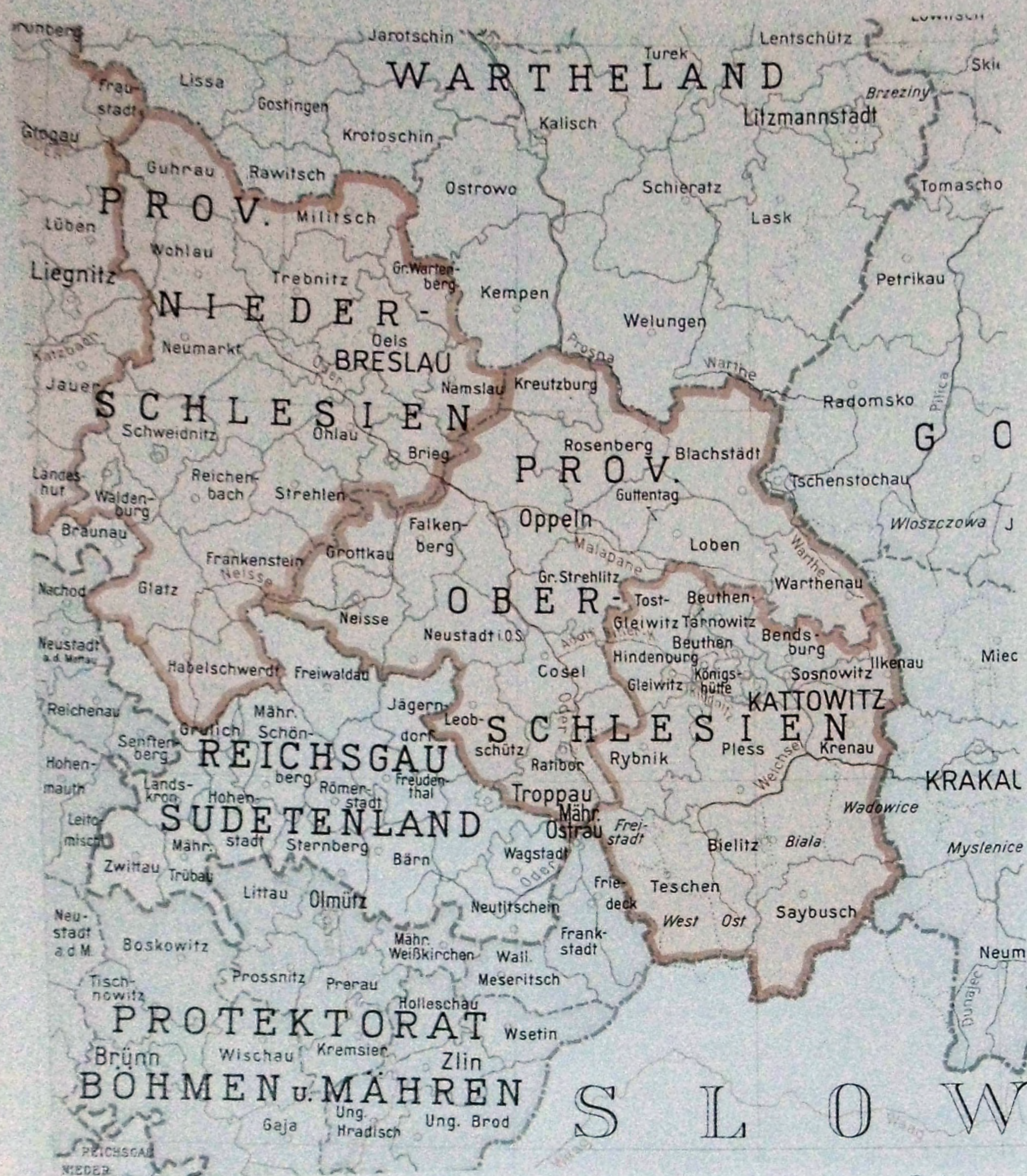
Ilustracja A.8. Prowincje górno- i dolnośląska w 1942 r. (źródło: Archiwum Państwowe w Katowicach, Zbiór kartograficzny, Provinzen Nieder- und Oberschlesien, 1942).

W 1922 roku historyczny Górny Śląsk należał zatem do trzech państw narodowych: Rzeszy Niemieckiej (prowincja górnośląska), Polski (województwo śląskie) i Czechosłowacji (kraj śląski, zmniejszony o wschodnią część Śląska Cieszyńskiego, za to powiększony o Kraik Hulczyński). Z tych trzech obszarów, obejmujących historyczny Górny Śląsk, jako pierwszy został zlikwidowany Śląsk Czeski – przez połączenie z Morawami w 1928 roku, nosząc odtąd nazwę „Kraj Morawsko-Śląski”. W 1949 roku wprowadzono w Czechosłowacji