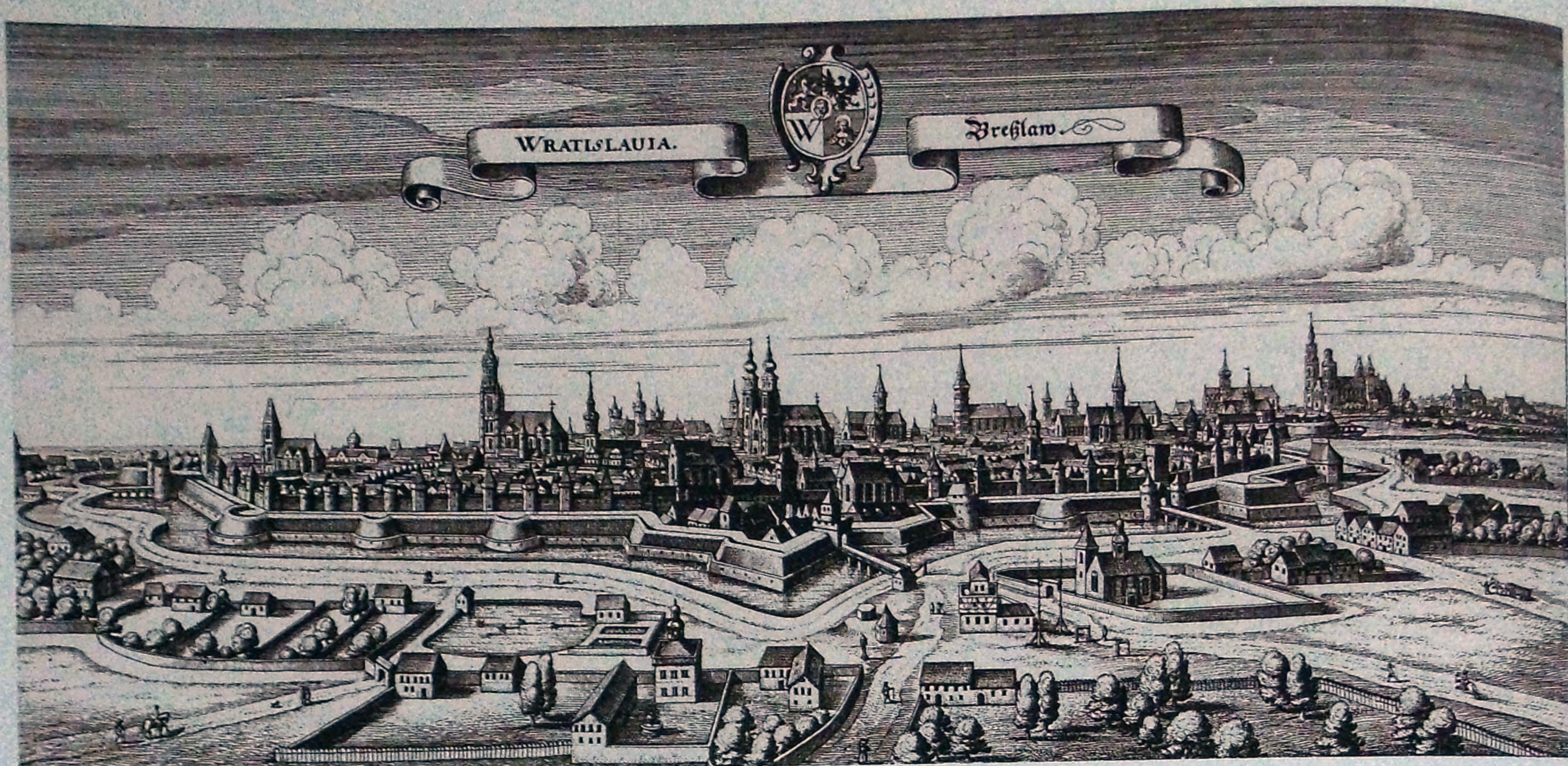
Ilustracja A.3. Widok Wrocławia na sztychu zamieszczonym w: Merian Matthäus, Topographia Bohemiae, Moraviae et Silesiae , Frankfurt am Main 1649.

w czasach ówczesnych u kronikarzy, jak na przykład Petera Eschenloera, ale i innych 21 – należał do trzech różnych diecezji. Żadna z siedzib biskupich (Wrocław, Kraków, Ołomuniec) jednak nie leżała na terenie Górnego Śląska.